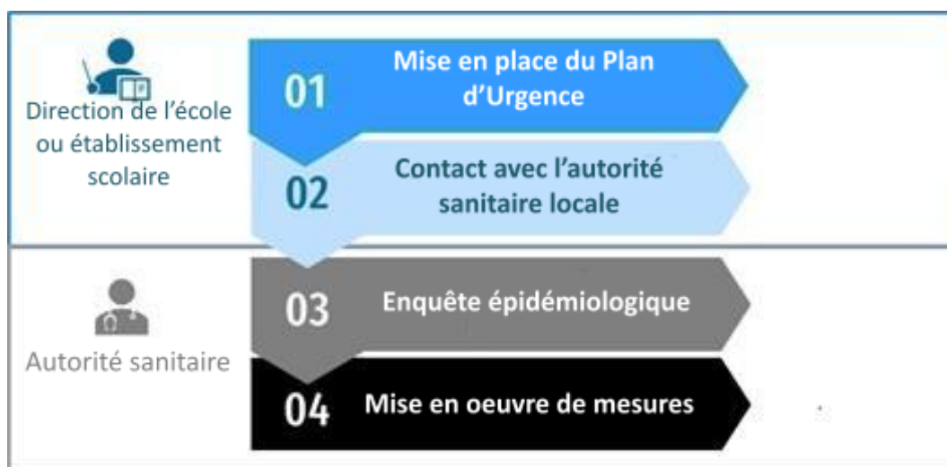
Diagramme de performance face à un cas confirmé de COVID-19 dans le contexte scolaire

Si le cas confirmé a été identifié en dehors de l'établissement scolaire, les étapes suivantes doivent être suivies cas d'identification d'un cas suspect, les mesures suivantes doivent être prises: