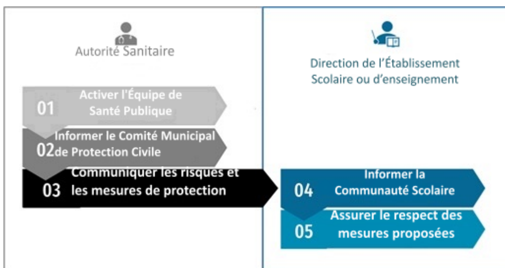
Figure 3. Diagramme de performance en cas d'apparition d'un foyer dans le contexte scolaire

En raison de son importance stratégique, l'articulation avec les partenaires de la communauté éducative doit être encouragée et renforcée. Il est essentiel de garantir le respect de toutes les procédures, en tant que stratégie d'implication dans l'ensemble du processus et, dans la mesure du possible, dans la prise de décision, par la participation de tous, dès le début, à la réponse à une épidémie