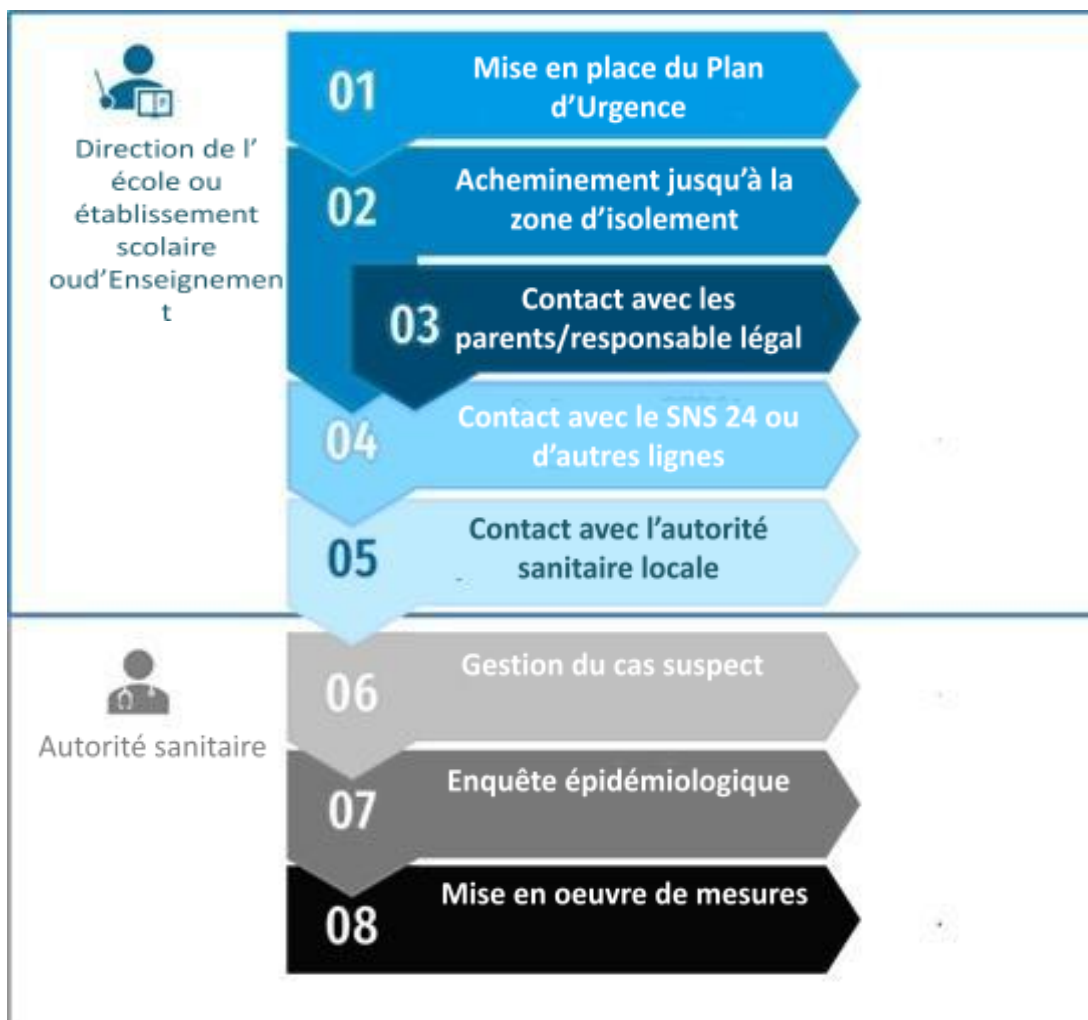
Diagramme de performance face à un cas suspect de COVID-19 dans le contexte scolaire

En cas d'identification d'un cas suspect , les mesures suivantes doivent être prises: